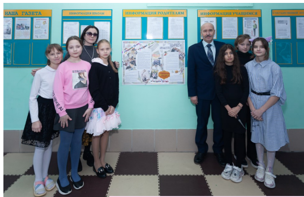
1 место 5а, 5б классы газета «Чердак—20 лет»

Пока жюри подводят итоги, в спортзале вновь кипит жизнь. Уже можно немножко расслабиться и выдохнуть: все, что ты смог сделать – сделано,