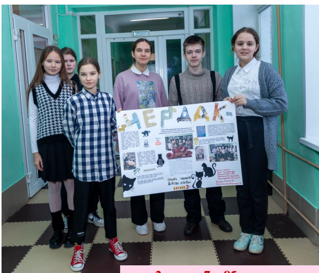
2 место 7г, 8б классы газета «Чердак»