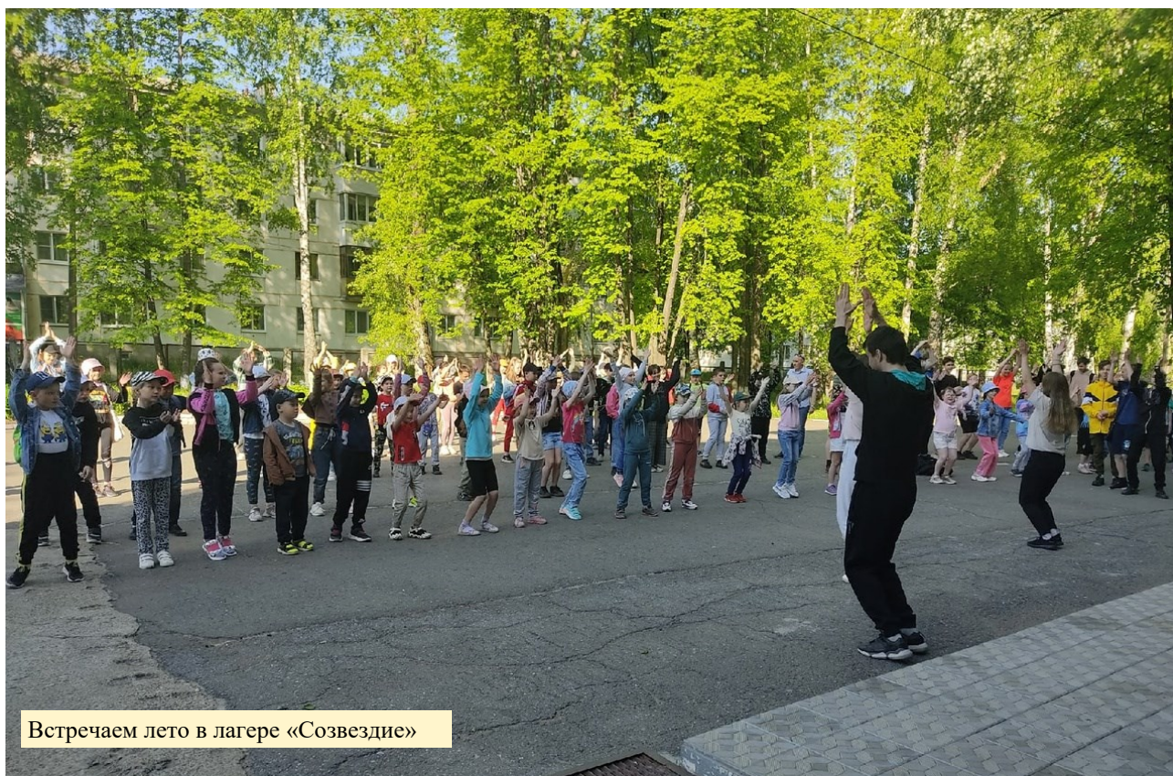
Встречаем лето в лагере «Созвездие»

Печатное издание МАОУ «средняя общеобразовательная школа № 4» выпускается с 5 декабря 2002 года.