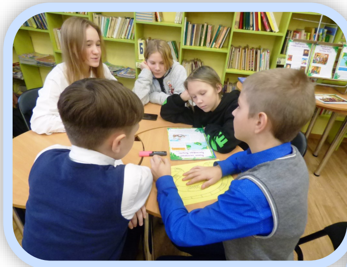
Команда 6-х классов «Бравлины»

Ребята, а вы знаете историю мореплавания Колумба? Предлагаем вам пройти викторину, о Христофоре Колумбе и его морских путешествиях в эпоху великих географических открытий.