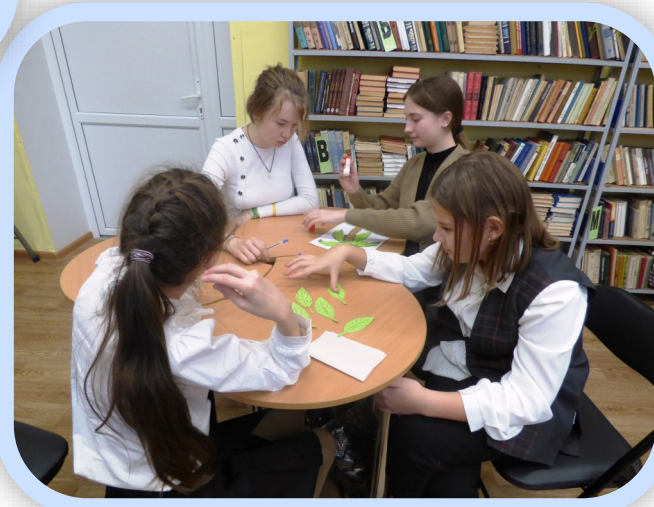
Команда 7-х классов «Полярная звезда»