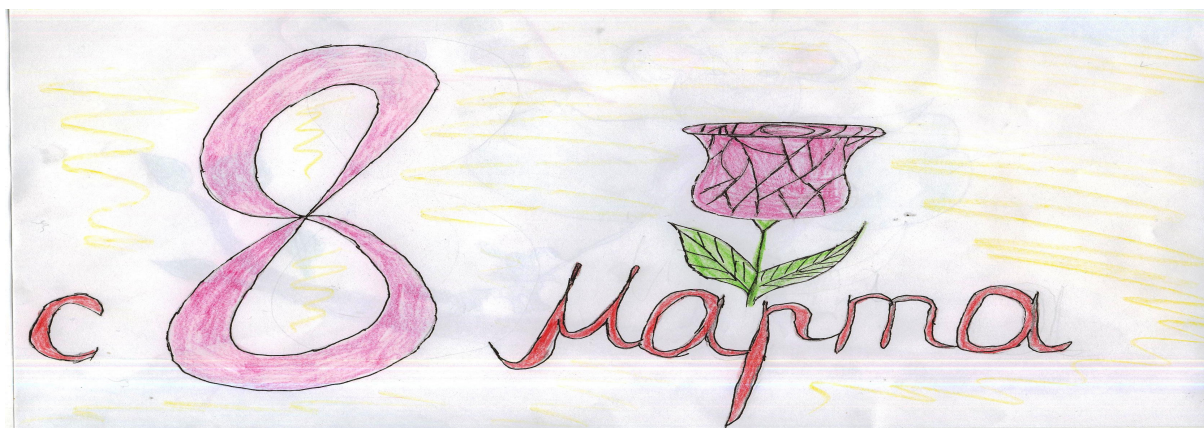
Рисунок: Азанова Люба 5а кл.

Я всех вас поздравляю И быть прекраснее весны От всей души желаю!