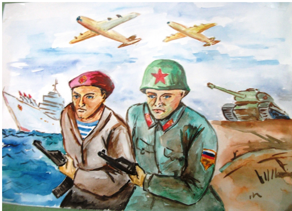
Рисунок: Игорь Кочев 7б класс