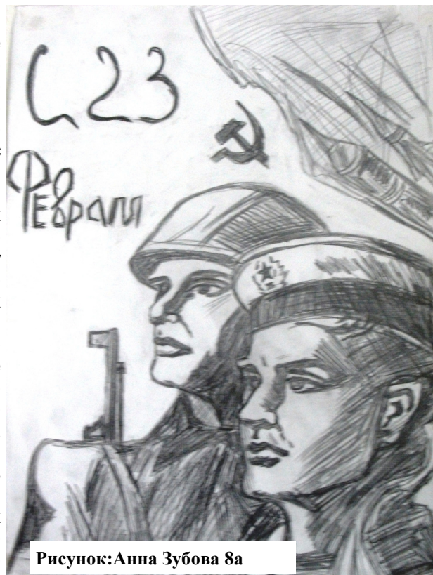
Рисунок: Анна Зубова 8а

На заседании киноклуба «Давайте смотреть хорошее кино» старшеклассникам был