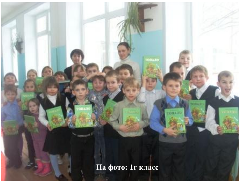
На фото: 1г класс

Детям в маленькие чашки Положили манной кашки. А потом малышки Почитали книжки. Прибежала кошка – Попросила ложку. Прибежала мышка –