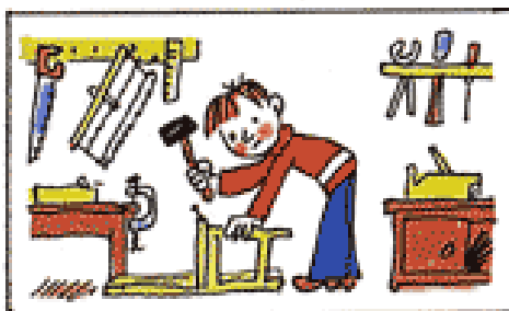
3. Наконец-то! Склеив стул, Гена радостно вздохнул.