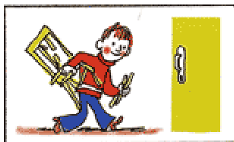
2. Стул сломался – не беда: Впереди урок труда.