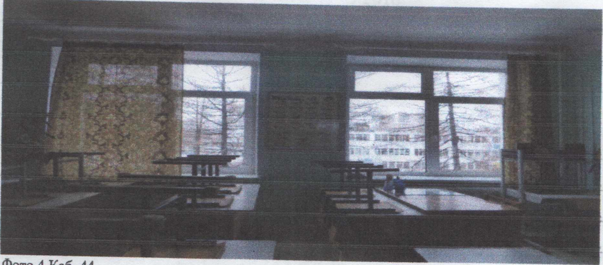
Фото 4 Каб. 44

4. Оборудовать светопроемы в учебных кабинетах №№ 41 и 44 регулируемыми солнцезащитными устройствами в соответствии с требованиями п. 7.1.8. СанПиН 2.4.2.2821-10. Фото 3. Каб. 41